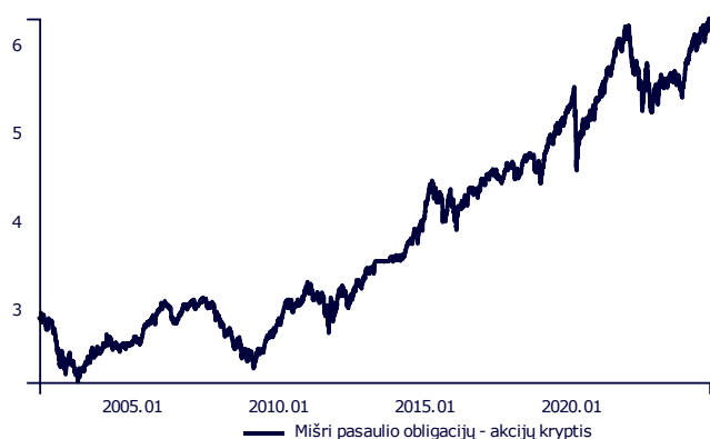
— Mišri pasaulio obligacijų - akcijų kryptis