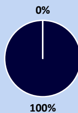
2. Su taksonomija suderintos investicijos, išskyrus valstybės obligacijas*